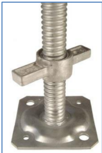
Steigervoetplaat of spindel

Ook als de werkhoogte minder dan 2,50 meter is, kan leuningwerk rondom de werkvloer nodig zijn, bijvoorbeeld als er op een vloerveld met open gevels en sparingen of vides wordt gewerkt, of als er gevaar bestaat te vallen op uitstekende delen en dergelijke.